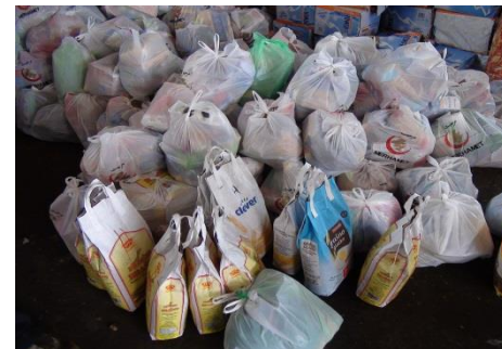
Freiwillige Helfer stellen Tüten mit den wichtigsten Dingen zusammen