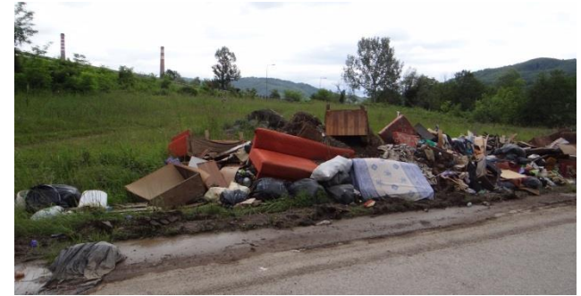
So sieht es über viele Kilometer am Straßenrand aus