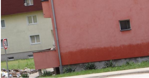
An den Häusern sieht man wie hoch das Wasser stand