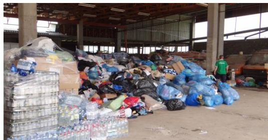
In einem Notlager Sammelt man die Spenden