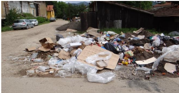
Überall Häuft sich der Müll