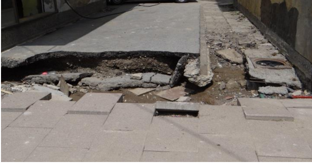
Bilder aus einer Stadt, die es besonders schwer traf