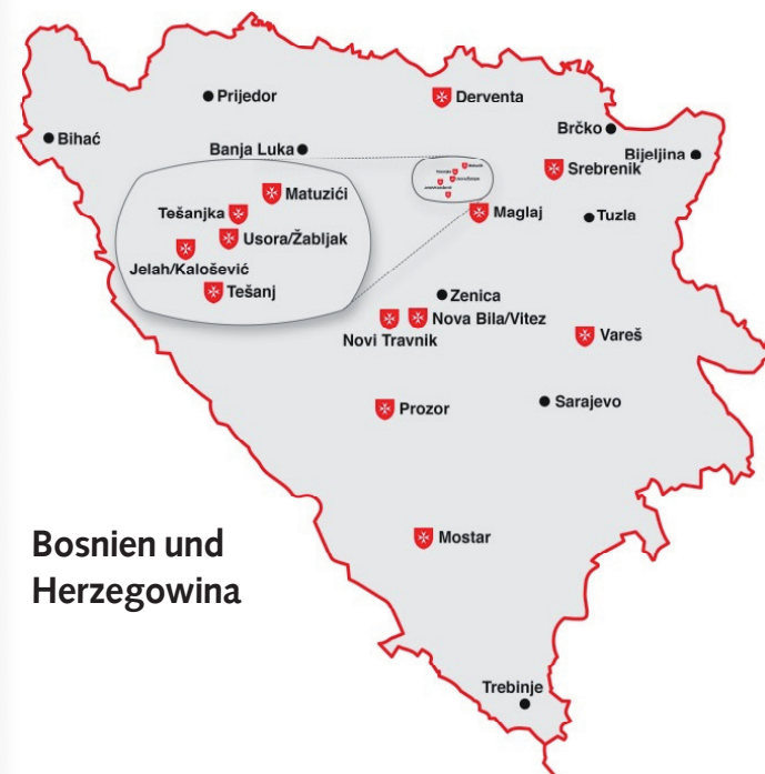
Bosnien und Herzegowina

Seit dem Start der Hilfe vor mehr als 20 Jahren haben die Limburger Malteser ihr Engagement stetig ausgebaut und mit immer mehr neuen lokalen Partnern den Kontakt gesucht. Inzwischen gibt es Kooperationen mit mehr als 10 Städten und Gemeinden.